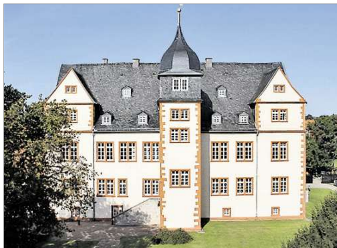
Bei der Rundfahrt nicht fehlen darf das Schloss Salder, in dem auch Salzgitters Museum untergebracht ist.

Der Stadtführer Harro Janouch bringt die Besucher dazu zu den attraktivsten Plätzen Salzgitters: So erfahren die Teilnehmer im Schlossmuseum Salder etwas über die geschichtsträchtigen Gemäuer der Wasserburg Gebhardshagen, und erhalten Einblick in die imposante Welt der Stahlwerke der Salzgitter AG.