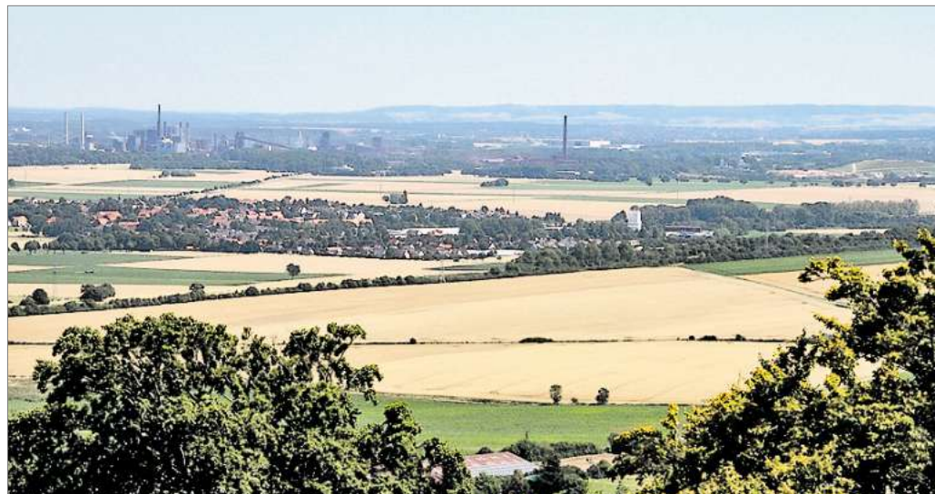
Neben den Arbeitsplätzen in der Industrie hat Salzgitter auch noch viel Landschaft und lohnenswerte Ausflugsziele zu bieten.

Die Kosten pro Person betragen 13 Euro inklusive Kaffee und Kuchen,